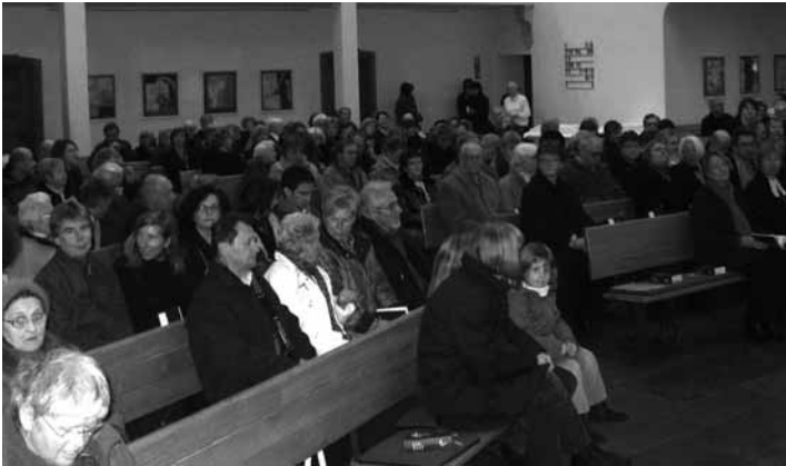
Gut besucht war der Fusions-Gottesdienst.