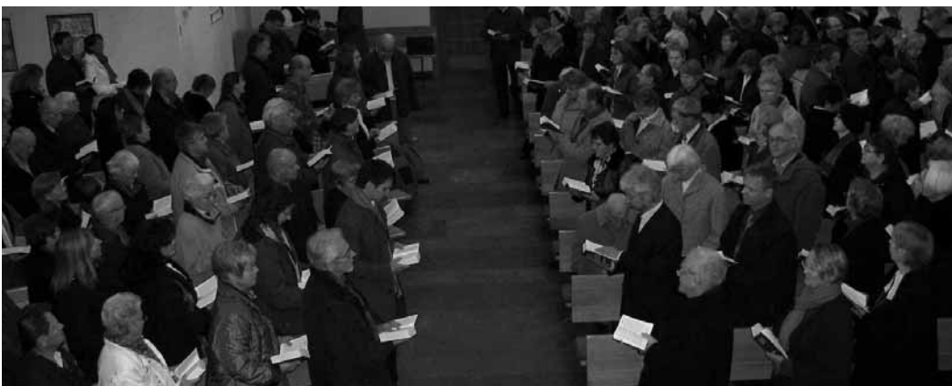
Singende Gemeinde singt sich gegenseitig Trost zu.