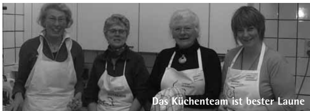
Das Küchenteam ist bester Laune