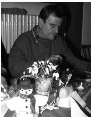
Essen in schöner Atmosphäre

Immer wieder wurde gefragt, ob denn nun auch die Bedürftigen, die wirklich Bedürftigen, kämen?!