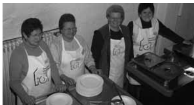
Bei uns gibt's was Leckeres!

Ein herzlicher Dank gilt allen, die durch große und kleine Spenden zum Gelingen der Vesperkirche beigetragen haben, insbesondere der Samariterstiftung für das Essen, der Kaiser-Brauerei für die Getränke, der Bäckerei Winkler für die Süßspeisen und dem Autohaus Schmid für die Bereitstellung des »Vesperkirchenmobils«. Und natürlich: den mehr als 50 ehrenamtlichen Helferinnen und Helfern!