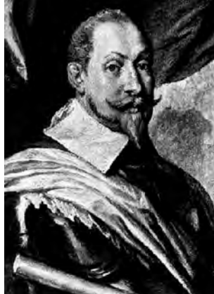
Schwedenkönig Gustav Adolf

Christliche Nächstenliebe nach dem biblischen Motto „Lasset uns Gutes tun an jedermann, allermeist aber an des Glaubens Genossen“ (Galater 6,10) verbindet die evangelische Kirche in Deutschland mit der Diaspora. Das ist der Grundgedanke, mit dem im Jahr 1832 in Leipzig die ‚Stiftung zur Unterstützung bedrängter evangelischer Gemeinden in der Zerstreung‘ ins Leben gerufen und nach dem Schwedenkönig Gustav Adolf benannt wurde.