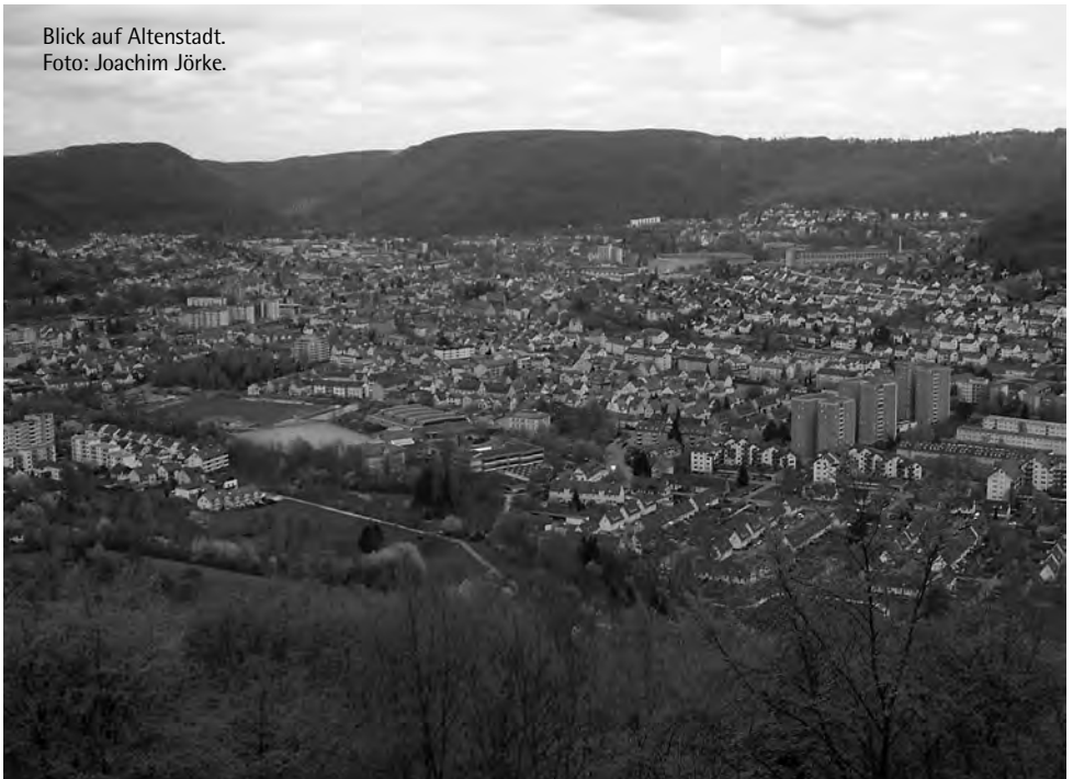
Blick auf Altenstadt.

Und Sie können dabei helfen! Wir möchten Sie herzlich einladen, sich mit uns auf den Weg zu dieser neuen Gemeinde zu machen, indem