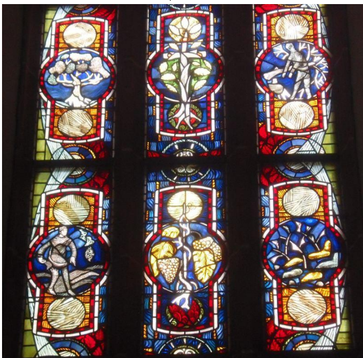
Rechtes Fenster unten