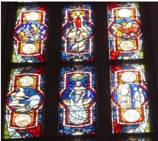
Rechtes Fenster Mitte